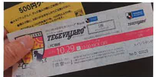
▲チケット全席100円! ゴール裏席は、スタグルクーポンも!!